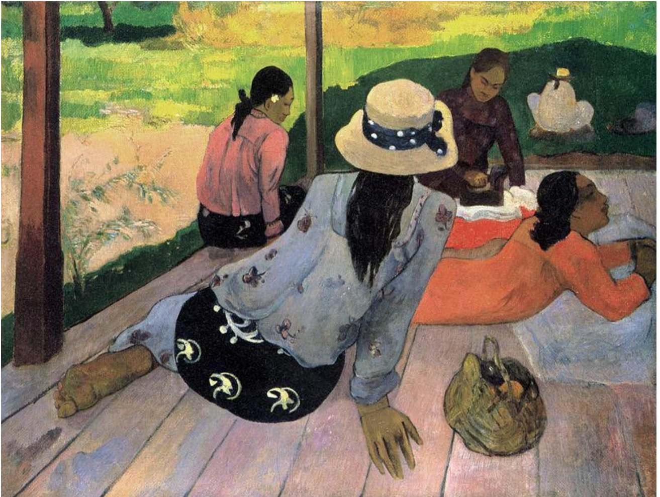
Paul Gauguin : La sieste , 1892-1894, huile sur toile, 88,9 cm x 116,2 cm, Metropolitan Museum of Art, New-york.